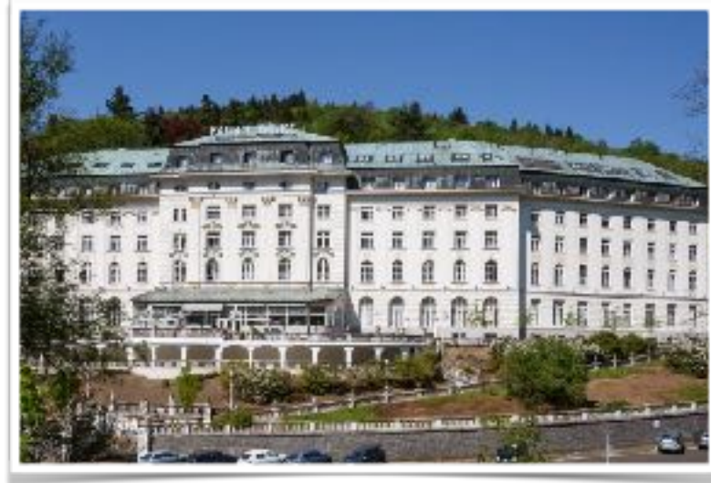
チェコ・ヤーヒモフのラドンパレス温泉病院